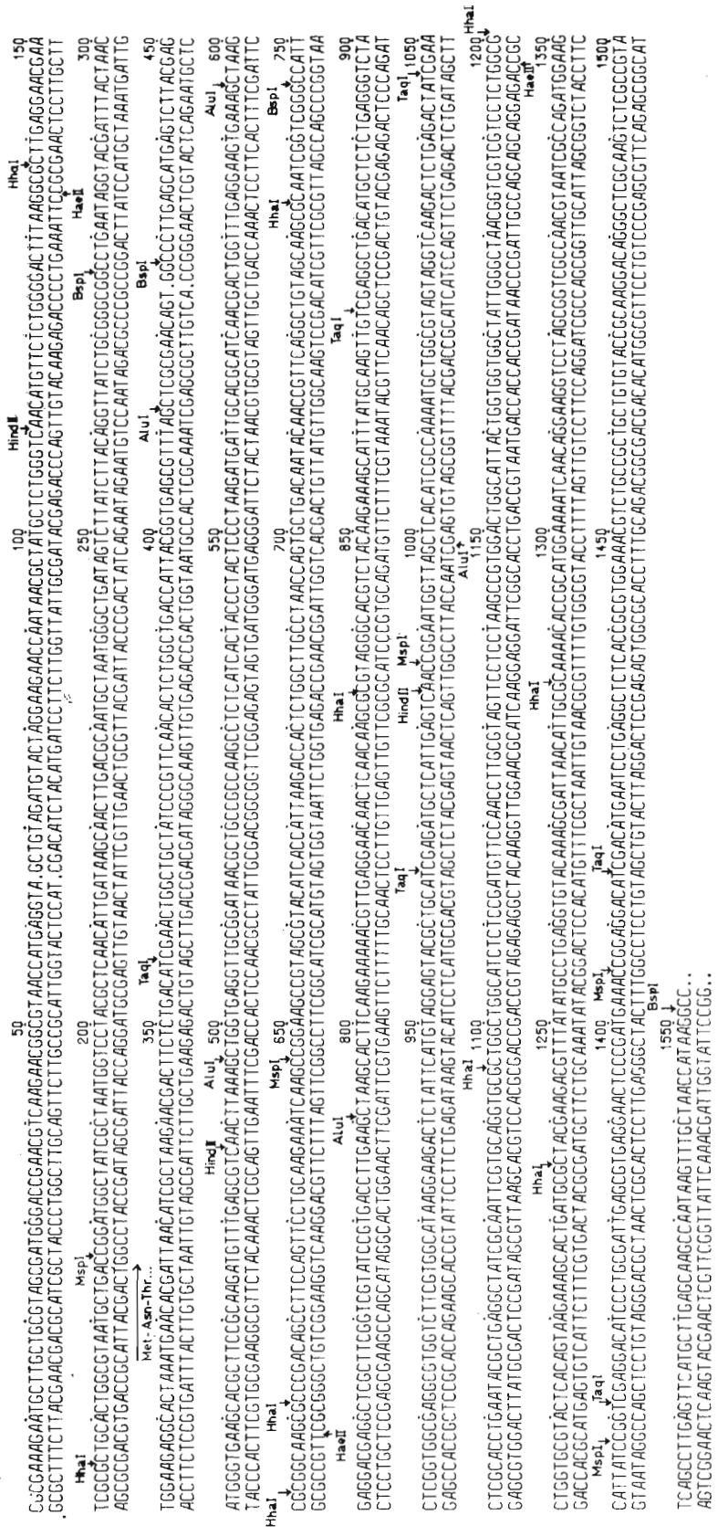
Рис. 2. Установленная в настоящей работе первичная структура левой половины гена 1 Т7 ДНК