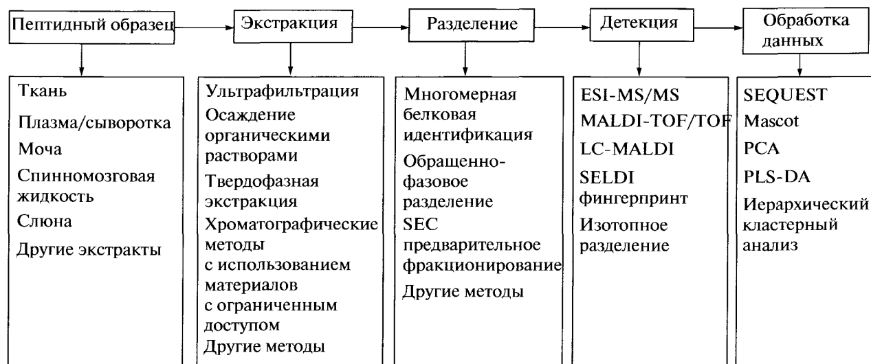
Рис. 1. Экспериментальная линейка методов и технологий в протеомике и пептидомике. LC – жидкостная хроматография; ESI-MS/MS – электроспрейная ионизация с тандемной масс-спектрометрией; MALDI-TOF/TOF – матрично-ассоциированная времяпролетная лазерная десорбция/ионизация; LC-MALDI – жидкостная хроматография с последующей матрично-ассоциированной лазерной десорбцией/ионизацией; SELDI – поверхностно-активированная лазерная десорбция/ионизация; SEQUEST – программа анализа данных тандемной масс-спектрометрии; Mascot – программа обработки данных времяпролетной масс-спектрометрии; PCA – компонентный анализ; PLS-DA – статистический метод – дискриминационный анализ наименьших квадратов.

раздел протеомики, анализирующий белки малой массы (<10 кДа), а также весь набор продуктов их протеолитической деградации in vivo и in vitro [5]. Как и белки, пептиды часто имеют достаточно специфичные функции, являясь гормонами, нейромедиаторами, цитокинами или факторами роста [6]. Некоторые пептиды, являясь продуктами ферментативной деградации белков в организме, часто служат индикаторами нормальных или патологических процессов, что может быть использовано при выявлении новых маркеров ранних стадий заболевания или медиаторов патологического процесса. В каком-то смысле, современные технологии пептидомики и протеомики направлены на разработку этих новых “полей” с целью нахождения отдельных индикаторных пептидов или белков и их идентификации, а также поиску алгоритмов для выявления и последующего использования эффективных комбинаций различных маркеров белково-пептидной природы для диагностики. В основном пептиды могут возникать следующими способами: деградацией белков протеолитическими ферментами внутри- и внеклеточной локализации, а также расщеплением препробелков и непосредственным синтезом.