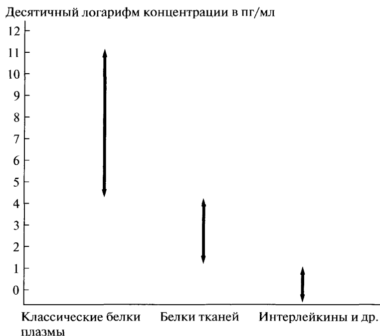
Рис. 2. Сравнение концентраций основных групп белков человека.

ные исследования смогут оперировать данными о присутствии в смесях единичных молекул, и проблема динамического диапазона, возможно, будет снята.